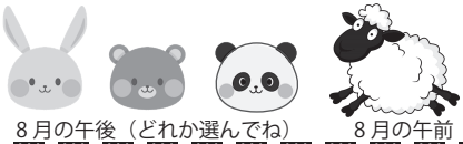
←8月の作品イメージ