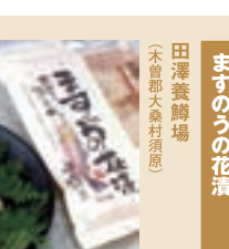
信州木曾街道生そば (株)霧しな (木曾郡木曾町開田高原西野)