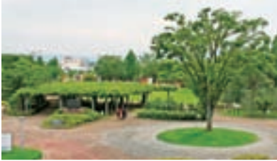
緑あふれる居心地のよい公園。