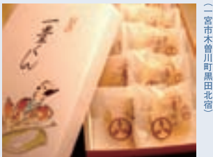
一豊くん 御菓子司 亀屋 (二宮市木曾川町黒田北宿)