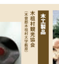
ますのうの花漬 田澤養鱒場 (木曾郡大桑村須原)