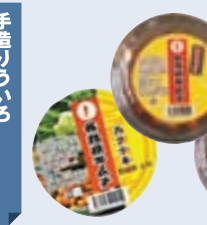
各務原キムチ メロンパン ホームフレンドキッチン(有) (各務原市鶴沼) ヤマワ (各務原市鶴沼)