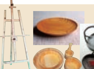
木工製品 木祖村観光協会 (木曾郡木祖村大字敦原)