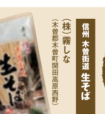
とまとのまんま (株)ふるさと企画 (加茂郡東白川村神土)