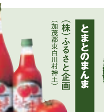
とまとのまんま (株)ふるさと企画 (加茂郡東白川村神土)