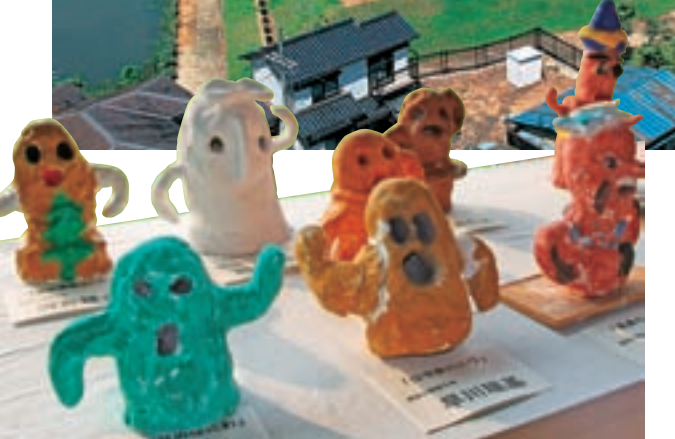
子供たちが作った楽しいオリジナルにはわ。

全長123メートルもの巨大な前方後円墳「青塚古墳」を中心に整備された公園。芝生広場は小石を取り除くなど手入れが行き届いており、安心して遊べます。園内には古墳について学べるガイダンス施設「まほらの館」もあります。