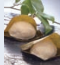
餡餅三喜羅 (有)大口屋 (江南市布袋町中)