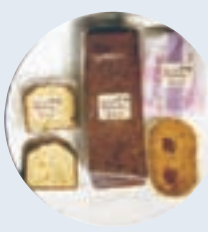
守口ケーキ ケーキ工房くりの樹 (扶桑町大字南山名)