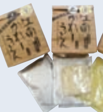
江南かれーうどん 布袋食糧(株) (江南市五明町)