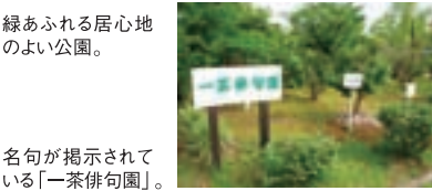
名句が掲示されている「一茶俳句園」。