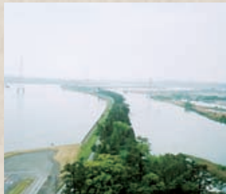
▲千本松原 (左側:長良川、右側:揖斐川)

ここで木曾川は人口河川として流れていることになる。ちなみに、千本松原より下流の長良川は、揖斐川の東側に新たに掘られた人工河川である。