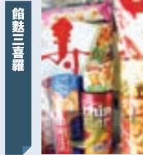
袋詰め菓子 綿清商店 (宮市大和町氏水)