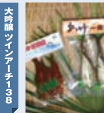
あゆの甘露煮 水野水産 (各務原市川島松原町)