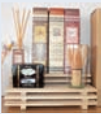
竹製品 ECM JAPAN (岐阜市柳津町)