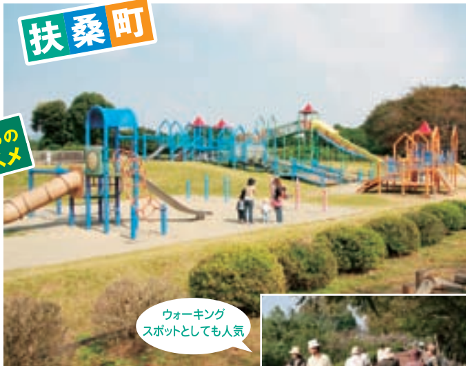
みんなで楽しめる遊具がいろいろ。