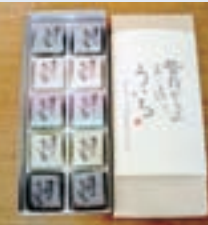
手造りういろ (有)みつ壺 (江南市五明町)