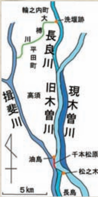
▲木曾三川の分流図

濃尾平野全体が「濃尾傾動運動」により西へ傾いているために、その上を流れる木曾川・長良川・揖斐川の木曾三川が西に偏って流れていることは以前にも触れた。三川は下流ほど互いに接近して流れるようになるために、堤防のない自然状態でみると、木曾川の水は長良川へ、長良川の水は揖斐川へ流れ込むことになり、長良川・揖斐川流域に多大な負担がかかることになる。それを解消するためには、三川を完全に分離し、それぞれ独立して伊勢湾へ流し出す方が必要になる。これを「三川分流工事」という。その最初の本格的工事が、薩摩藩士によりなされた有名な「宝曆治水」であり、千本松原で有名な木曾川と揖斐川の分流工事がその代表的工事である。現在の千本松原では、長良川と揖斐川が分けられているが、当時の長良川は羽島市桑原町で木曾川に合