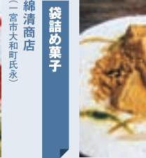
黒糖わらび餅 明や (宮市小信中島)