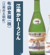
大吟醸ツインアーチ138 金銀花酒造(株) (二宮市今伊勢町馬寄)