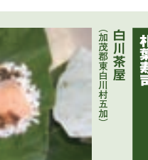
朴葉寿司 (加茂郡東白川村越原)