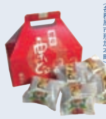
樽の栗どし (株)餅信 (各務原市那加本町)