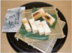
鮎燻燥 笠松町商工会飲食部会 (羽島郡笠松町春日町)