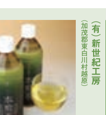
東白川茶商品 (有)新世紀工房 (加茂郡東白川村越原)