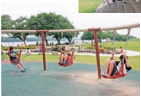
木陰で川を眺めながらのんびり。

今日はお弁当を持ち寄ってみんなで集まりました。広くてきれいなので子供も大喜びで思い切り走り回っています。