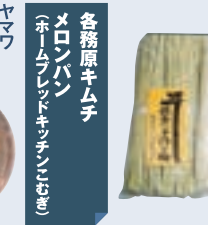
銀杏関連品 稲沢市観光協会 (稲沢市朝府町)