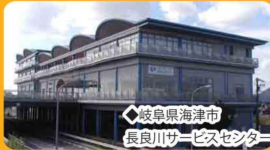
◆岐阜県海津市 長良川サービスセンター