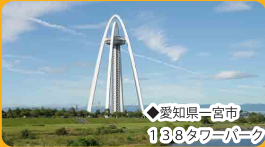
◆愛知県一宮市 138タワーパーク