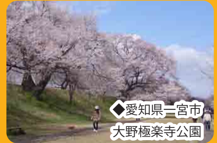
◆愛知県一宮市 大野極楽寺公園